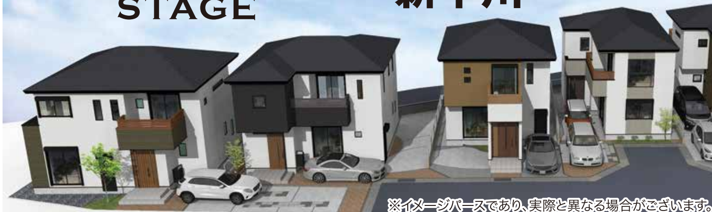
※イメージパースであり、実際と異なる場合がございます。